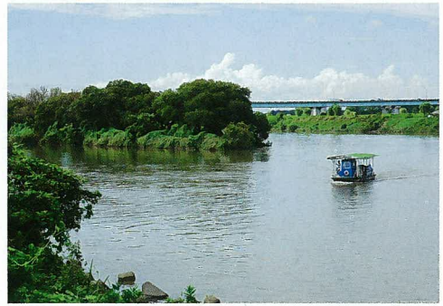
荒川の自然と船 (荒川・さいたま市)

写真の右上を流れる川は荒川、左上を流れているのは入間川です。それぞれの川が合わさり、終点の東京湾まで注いでいきます。川沿いは緑が多く自然が残っており、河川敷には野球場やゴルフ場などの運動場などが整備されているので、県民や都民の憩いの場にもなっています。