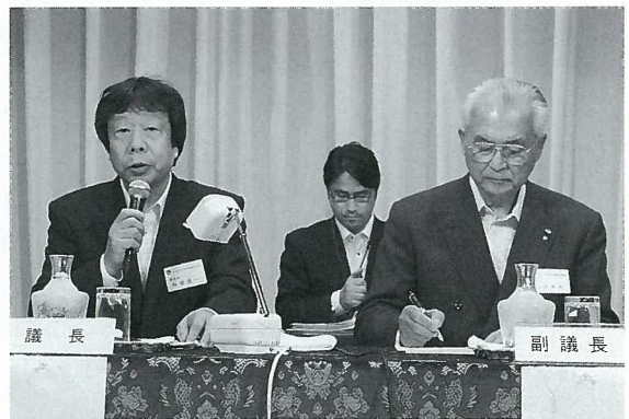
左 保坂議長 右 河井副議長