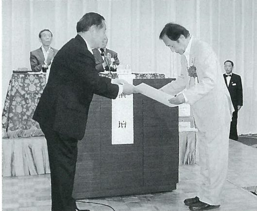
上田知事へ今夏の知事選出馬要請！

5月27日(金)、さいたま市浦和区の浦和ロイヤルパインズホテルにおきまして、第41回年次大会に会員3,956名（うち委任状提出者3,768名）が出席し、盛大に開催いたしました。