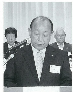
監査報告 三井監事