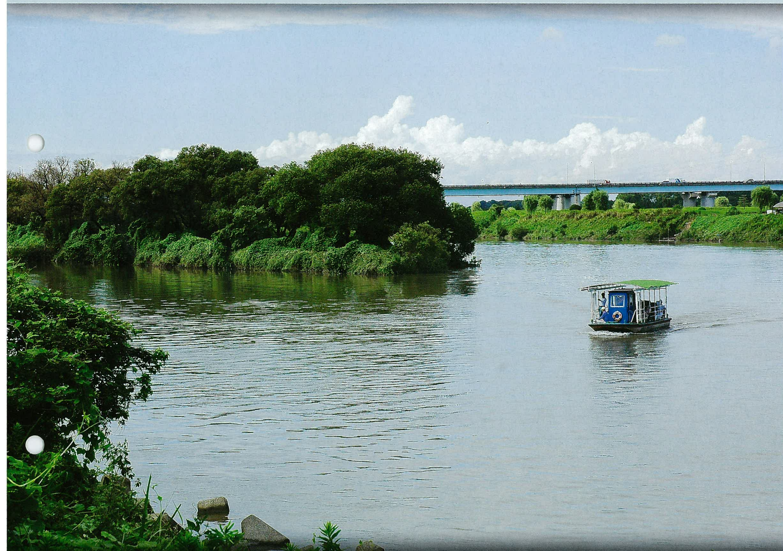
川の国埼玉フォトコンテスト第1回ジュニア部門 「荒川の自然と船」(荒川・さいたま市) 野島 佑紀