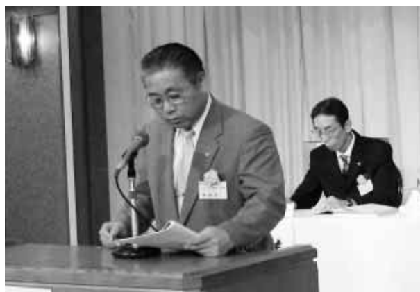
監査報告 新居監事