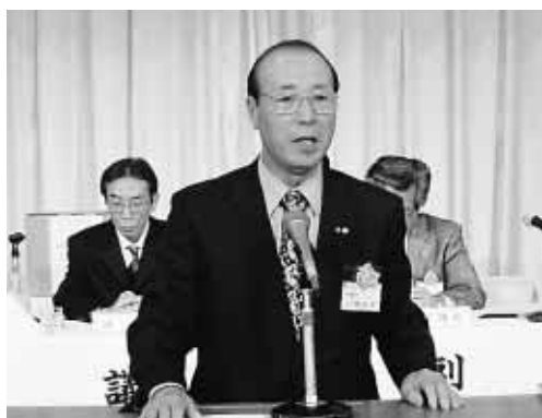
提案説明 三城幹事長