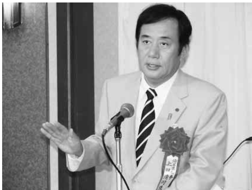
推薦の感謝のことばを述べる上田清司県知事

推薦状授与の挨拶では、上田知事から「推薦状をいただけるとは身に余る光栄です。皆様の期待に背かないよう県民のために全力を尽くします。」と推薦の感謝と2期目の県政への意気込みの御言葉をいただきました。